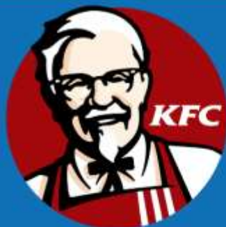
肯德基 (kěndéjī) KFC