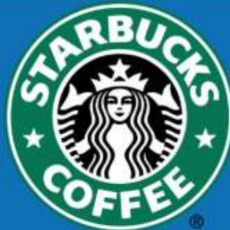
星巴克 (xīngbākè) Starbucks