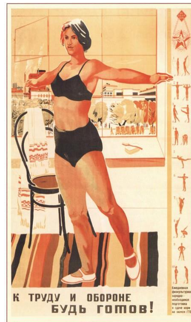
496. Кокорекин А. К труду и обороне будь готов! 1934

Б) Это политическая деятельность среди широких масс, имеющая цель распространение идей.