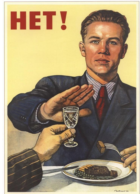
420. Гайдаров В. Нет! 1954