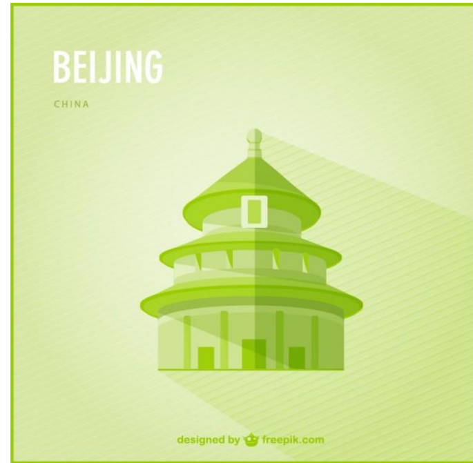
běi jīng 北京