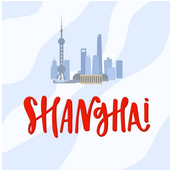
shàng hǎi 上海